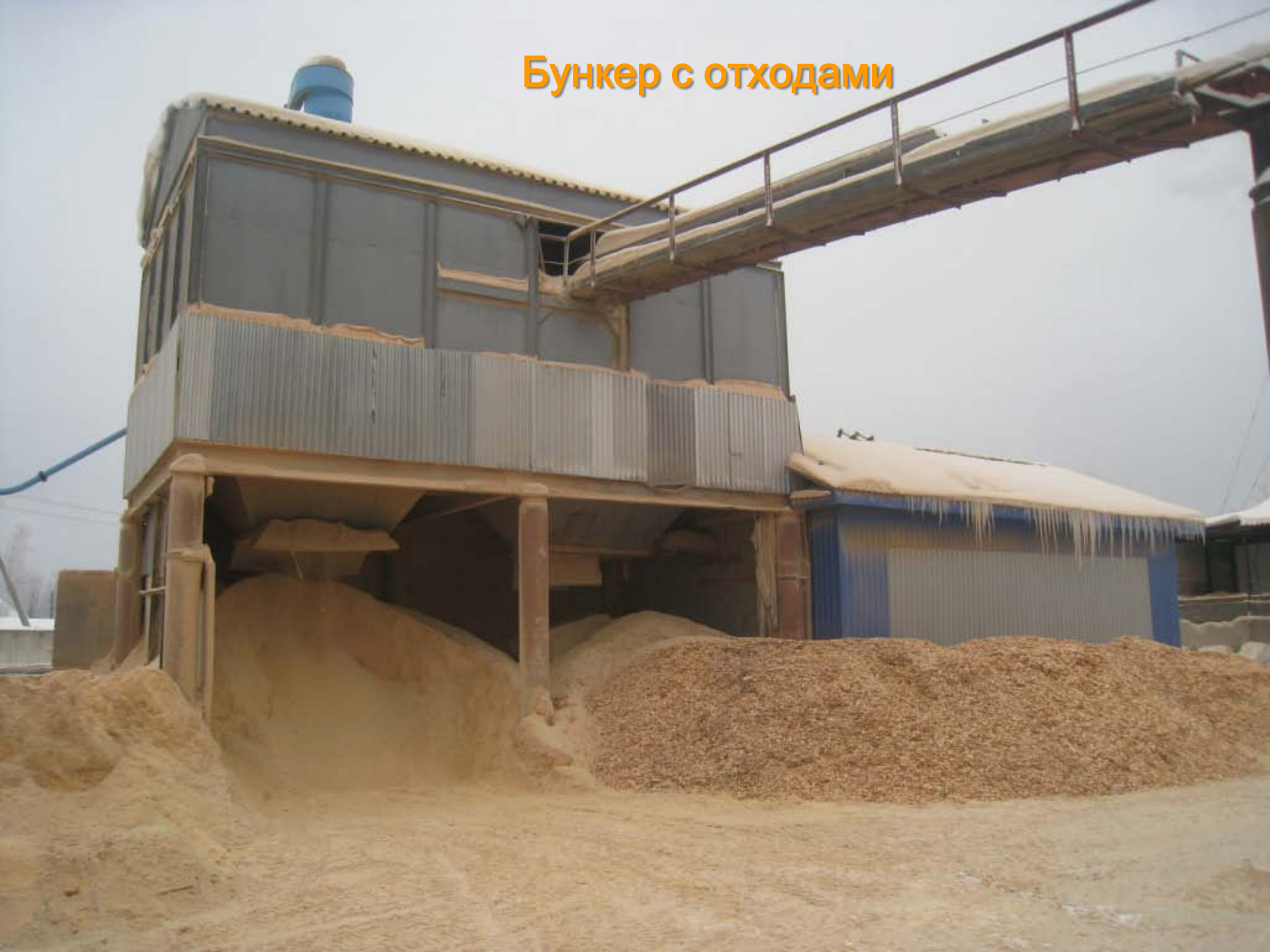
Бункер с отходами