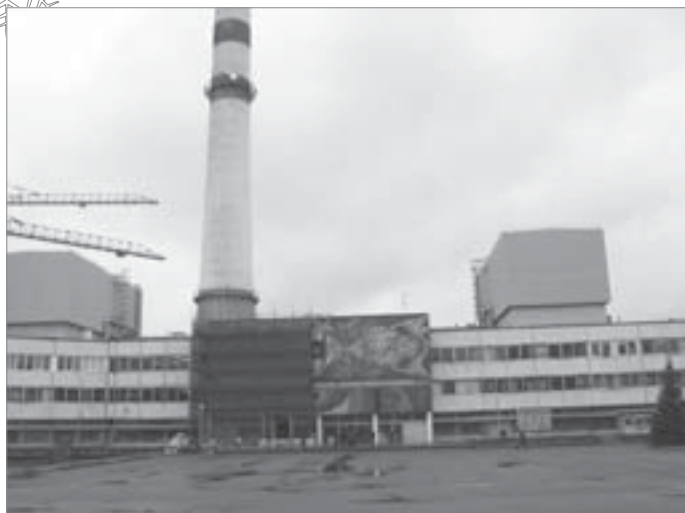
Первый блок Ленинградской АЭС. Старичок ещё подышит?