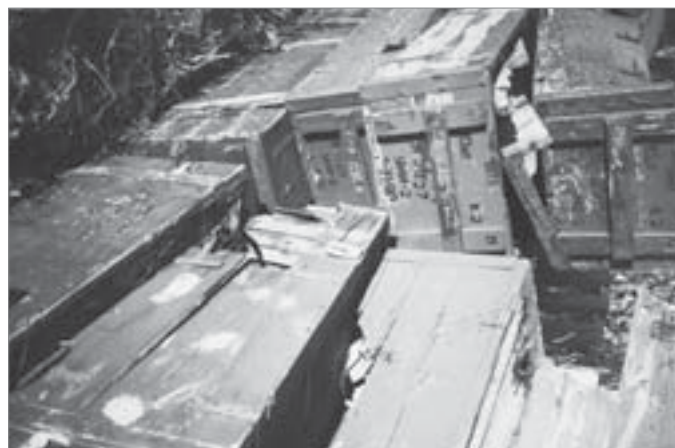
Ящики рассыпаются, боеприпасы ржавеют

Власти убеждают население, что хранение и переработка химоружия и получившихся в результате отходов не пред-