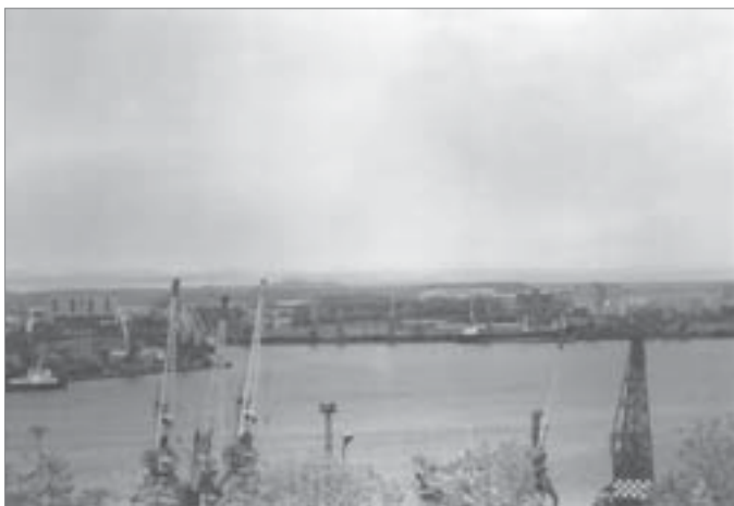
Стоки сотен промышленных предприятий сбрасываются в залив