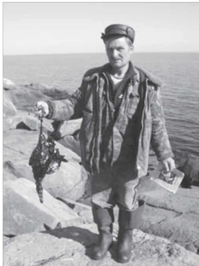
Погибли тысячи уток

И тогда жители Онежского района направили обращение к главе администрации МО «Онега и Онежский район» и депутатам городского Собрания и требованием свернуть работы по перекачке нефти. В нем, в частности, говорится: «Требуем немедленно прекратить экологически опасные работы в Онежском заливе и срочно отправить танкеры по месту приписки. Никакими рабочими местами и налогами не окупить тот ущерб, который причинен заливу».