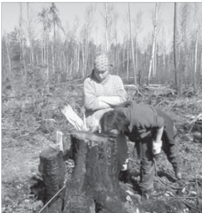
Здесь горел лес и, если не засадить эту землю, вырастет кустарник