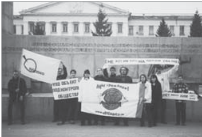
Зеленые не раз протестовали

Технология, по которой собираются уничтожить оставшиеся БОВ, опробована только в лабораторных условиях. Ведутся споры о степени токсичности полученных в результате переработки отходов, которые