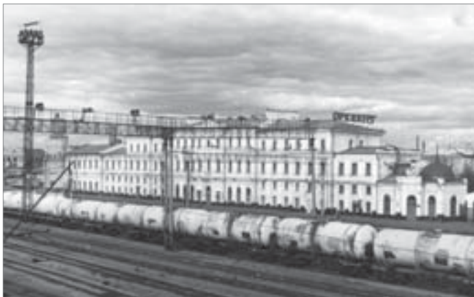
В Оренбург воду будут возить цистернами?

Итог кампании — 2 561 268 подписей граждан России. Но референдум не состоялся из-за значительного «брака» в подписях, обнаруженного Центризбиркомом. Например, в Оренбургской области было собрано тогда официально 170 456 подписей, что составило 11,2 процента избирателей. Это оказалось лучшим относительным результатом в России, а по абсолютному показателю первое место заняла Москва — 191 609 подписей. Но в столице и населения больше, чем в Оренбуржье, почти в четыре раза.