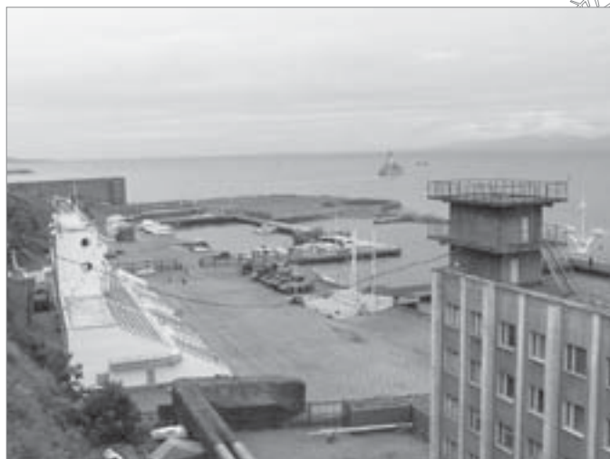
Скоро сюда никто не поедет отдыхать

Сегодня спасением Амурского залива пытаются заниматься сразу несколько солидных научных учреждений, таких, как Институт защиты моря ДВГМА им. адмирала Невельского, Тихоокеанский институт географии ДВО РАН, а также Морской экологический фонд и Специализированная Дальневосточная морская инспекция. Пытаются оказать помощь и Всемирный фонд дикой природы... Но Амурский залив медленно умирает. Танатологическое отделение краевого бюро судебно-медицинской экспертизы работает без выходных, как, впрочем, и многие другие учреждения города, не имеющего очистных сооружений.