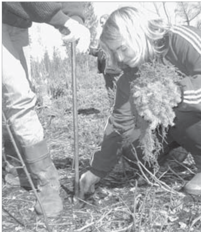
Вот так сажают маленькие елочки

Пока выходит это по-разному. То лучше, то хуже. Стоит зазеваться «Спецтрансу», не вывезти «общий мусор», как в короб со старательно отобранной жителями бумагой или