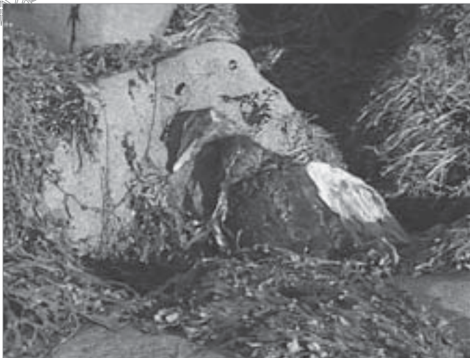
Птицы умирали мучительной смертью