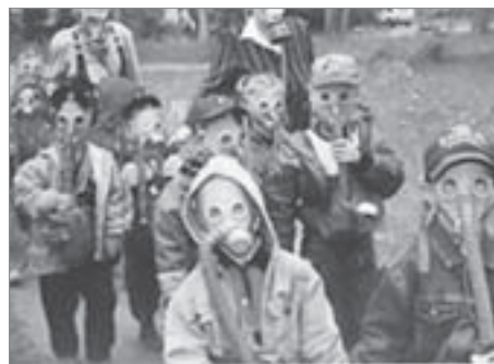
Учения. Июнь 2002 года

Средства защиты (противогазы), которыми должно быть обеспечено население, проживающее в зоне защитных мероприятий, хранятся в 200 км от г. Щучье. Системы оповещения нет. В некоторых деревнях зоны нет телефонов, нет и провод-