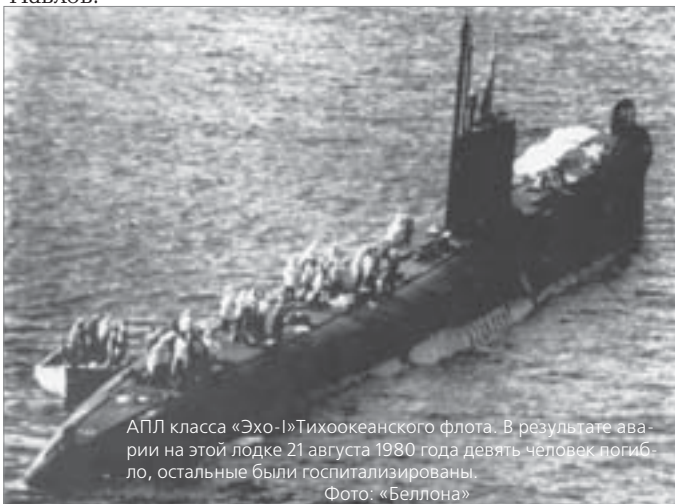
АПЛ класса «Эхо-I» Тихоокеанского флота. В результате аварии на этой лодке 21 августа 1980 года девять человек погибли, остальные были госпитализированы.